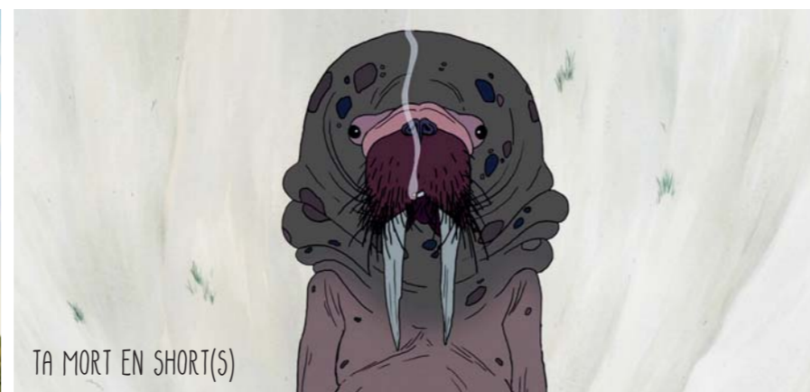
TA MORT EN SHORT(S)