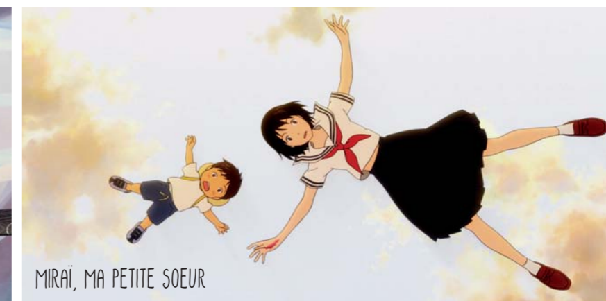
MIRAI, MA PETITE SOEUR