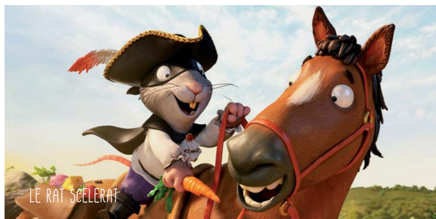
LE RAT SCELERAT