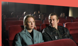
LES FEUILLES MORTES de Aki Kaurismäki