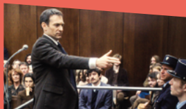
LE PROCÈS GOLMAN de Cédric Kahn