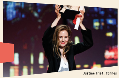
Justine Triet, Cannes

Une chose est sûre, impossible de vous ennuyer tout au long de ce Bel été à l'Atalante : cycles thématiques - thrillers, cinéma espagnol -, films culte ou séances de répertoire (comme la rétro consacrée à Lars Von Trier dans la foulée du Festival de La Rochelle), concerts ou Dj sets tous les jeudis... La proposition est pléthorique et volontiers éclectique, elle mise sur votre curiosité et sur votre envie de profiter de cette période particulière pour vous replonger dans les films marquants qui ont bercé notre cinéphilie, en particulier celles des années 90 (VIRGIN SUICIDES, LE PÉRIL JEUNE, mais aussi MEMENTO pour faire écho au dernier film de Christopher Nolan, tous présentés en version restaurée).