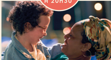
Semaine de la Critique Cannes 2023