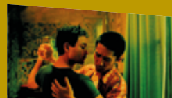
RÉTRO WONG KAR WAI