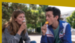
LA FILLE DE SON PÈRE de Erwan Le Duc