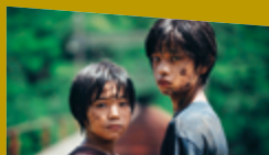
L'INNOCENCE de Hirokazu Kore-eda