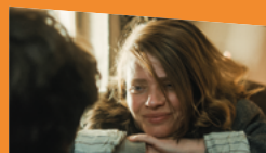
LA CHAMBRE DE MARIANA d'Emmanuel Finkiel