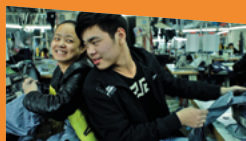
JEUNESSE (LES TOURMENTS) de Wang Bing