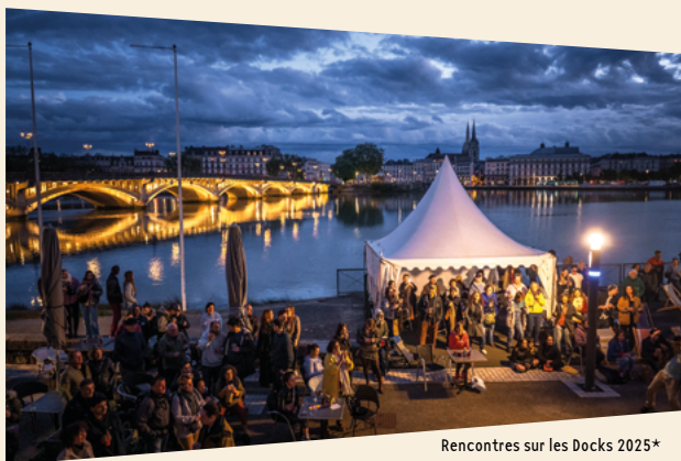
Rencontres sur les Docks 2025*

Plus nous serons nombreux, et plus nous serons forts pour résister.