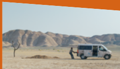
UN SIMPLE ACCIDENT de Jafar Panahi