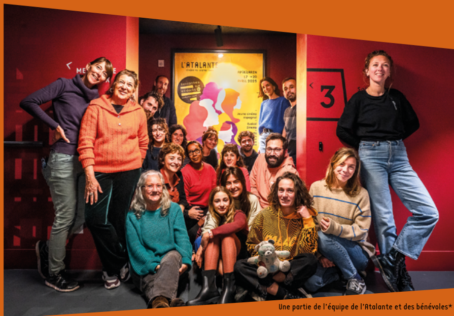
Une partie de l'équipe de L'Atalante et des bénévoles*