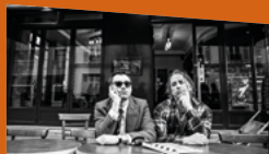
NOUVELLE VAGUE de Richard Linklater