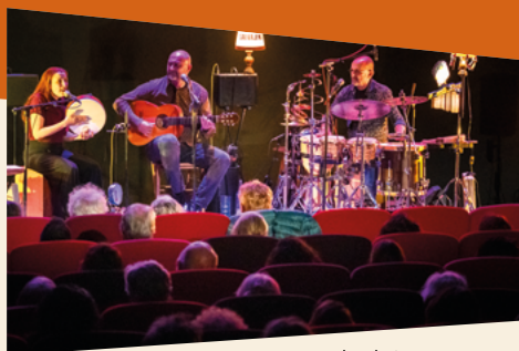
Concert de Salvajenco - Rencontres sur les Docks 2025*