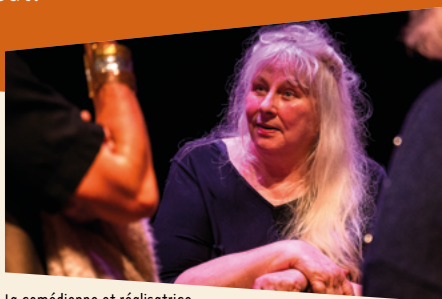
La comédienne et réalisatrice Yolande Moreau*

Ce combat, nous avons réussi à le mener jusqu'à présent grâce à l'énergie et à l'implication des bénévoles et salariés qui font vivre le projet, grâce à la ferveur d'un public qui vient toujours plus nombreux dans nos salles d'année en année, grâce au soutien des collectivités (et notamment le partenaire historique qu'est la ville de Bayonne), mais aussi, et surtout, grâce au soutien renouvelé, chaque année, de nos adhérents.