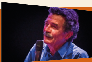
Le journaliste Edwy Plenel (Mediapart)*

Vous le savez sans doute, L'Atalante, c'est un projet associatif un peu fou, commencé il y a près de 35 ans, en 1990, par une poignée de spectateurs accros à la VO.