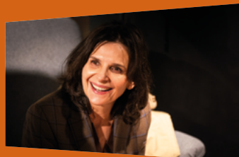
La comédienne Juliette Binoche*

Ceux qui se sont groupés et ont adhéré à l'association Cinéma et Cultures en ce temps-là se souviennent de toutes les difficultés qu'il a fallu affronter pour pouvoir simplement rester ouverts quelques mois de plus, un an de plus... Ce fut le cas de nombreuses années durant, et aujourd'hui encore rien n'est acquis.