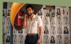
L'AGENT SECRET de Kleber Mendonça Filho