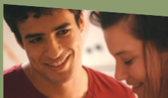
MEKTOUB MY LOVE, CANTO DUE d'Abdellatif Kechiche