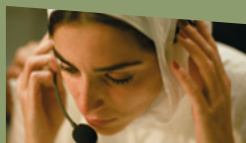
LA VOIX DE HIND RAJAB de Kaouther Ben Hania