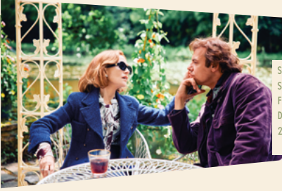
SÉANCE SPÉCIALE – FESTIVAL DE CANNES 2025