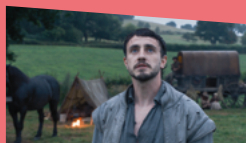
HAMNET de Chloé Zhao