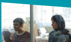
WOMAN AND CHILD de Saeed Roustaei