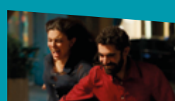
UN MONDE FRAGILE ET MERVEILLEUX de Cyril Aris