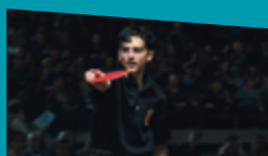
MARTY SUPREME de Josh Safdie