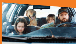
SUR LA ROUTE D'OMAHA de Cole Webley