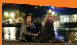
SOUDAIN de Ryūsuke Hamaguchi