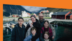
FJORD de Cristian Mungiu